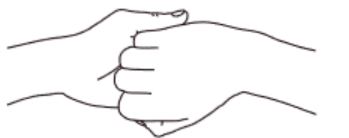
4 Paume/doigts Désinfection des doigts