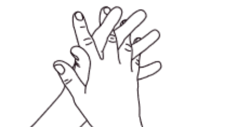
3 Doigts entrelacés Désinfection des espaces interdigitaux et des doigts