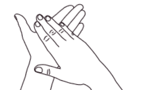
1 Paume sur paume Désinfection des paumes

La friction est réalisée en 7 points et renouvelée autant de fois que possible dans la durée impartie. Cette durée sera d'au moins 20 secondes et à définir en fonction du produit.