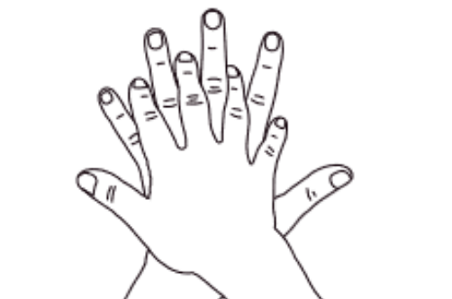
2 Paume sur dos Désinfection des doigts et des espaces interdigitaux