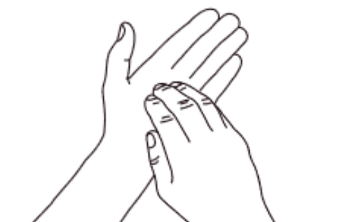
6 Ongles Désinfection des ongles