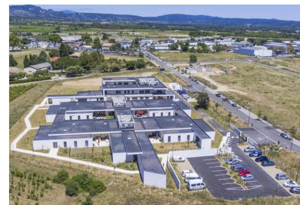
MAS L'Ensoleillade –

Composé de 5 établissements et Services (MAS, IME, SESSAD, URR et CMPP), le dispositif offre des réponses plurielles et adaptées aux besoins des personnes en situation de handicap du territoire et aux enfants-adolescents présentant des difficultés scolaires, psychiques et/ou des troubles des apprentissages.