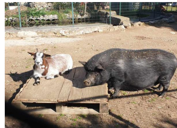
La ferme pédagogique de l'IME L'Ensoleillade