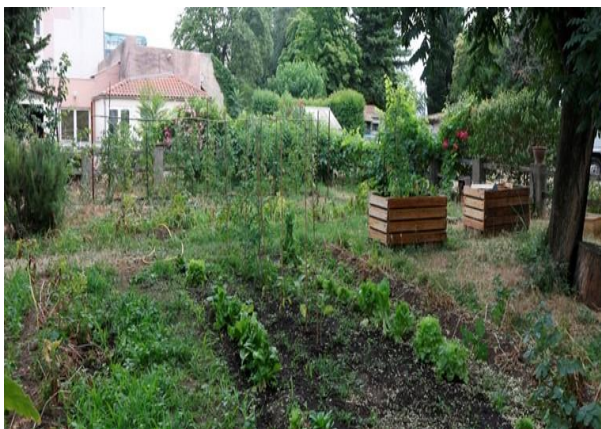
Le Potager de l'IME L'Ensoleillade